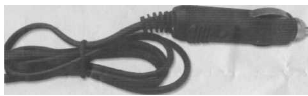
Разъем для зажимов автомобиля